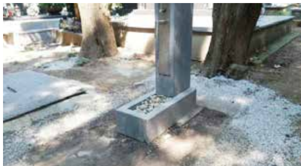
Jedna z nových fontán na cintoríne.

Technické služby mesta dokončili osádzanie nových fontán s pitnou vodou v areáli Mestského cintorína v Zlatých Moravciach. Celkovo ich je desať v hodnote takmer 7-tisíc eur.