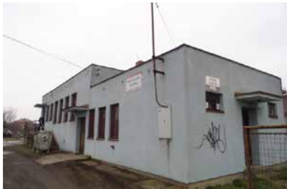
Pálenica v Zlatých Moravciach.

Boli schválené podmienky, na základe ktorých museli záujemcovia ponúknuť minimálne 2 000 eur ročné nájomné za stavbu a pozemok. Pokiaľ by bola využívaná ešte stará destilačná technológia, jej prenájom bol stanovený na 5 centov za jeden liter vypáleného čistého liehu. Po zakúpení novej technológie by tá stará putovala do zberu a získané peniaze by zinkasovala samospráva. Prenájom pálenice bol ponúkaný na 10 až 15 rokov.