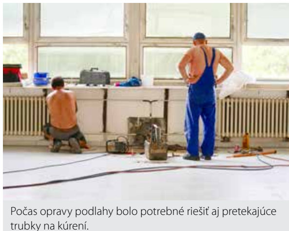
Počas opravy podlahy bolo potrebné riešiť aj pretekajúce trubky na kúrení.

Ako sme vás informovali v júlovom čísle, Základná škola (ZŠ) Robotnícka mala problém so svojou jedálňou. Začala sa tam prepadať podlaha. Škola preto požiadala svojho zriaďovateľa – Mesto Zlaté Moravce o finančnú pomoc. V súčasnosti je už podlaha opravená.