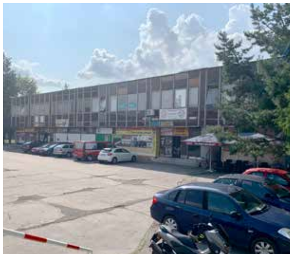
Stredisko občianskej vybavenosti na Duklianskej ulici.

„Kocka“ je od svojho vzniku využívaná výlučne na obchod a služby. „Sú tu predajne