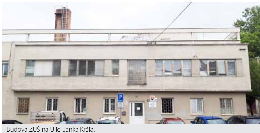
Budova ZUŠ na Ulici Janka Kráľa.