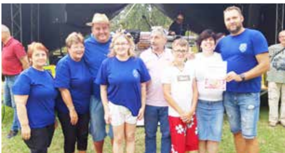
Tím mestských poslancov.