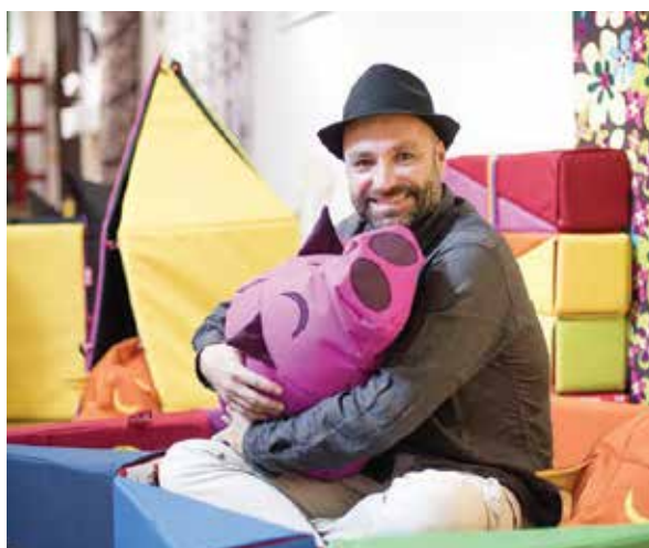
Michal Stasko: archív RTVS