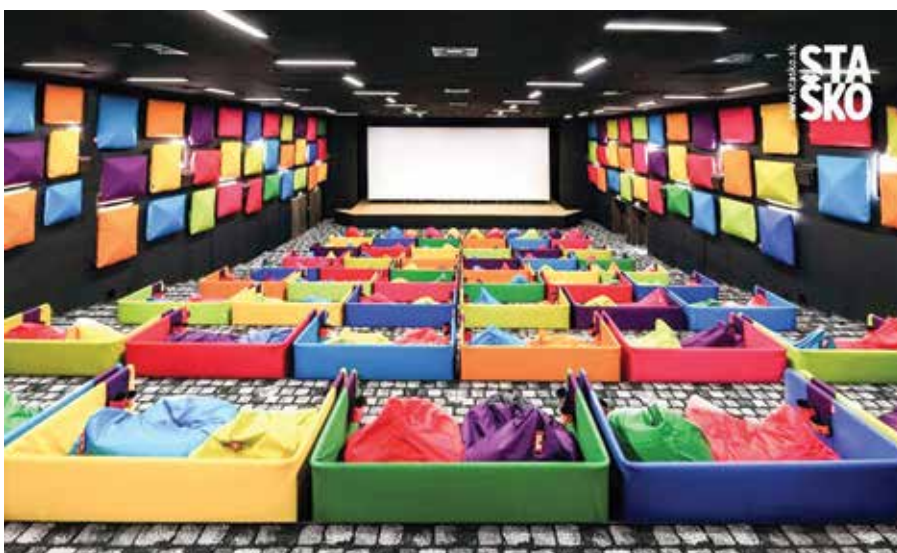
Pri zariadení: archív MS

Potom sme sa nepočuli pár rokov a keď sa začala pandémia, mi zavolať, že som mu ušetril veľa peňazí a trápenia. Zistili, že sú vlastne mestskí ľudia a žiadny dom nepotrebovali. Že sa im žije dobre, lebo by sa zbláznil, keby mali deti v satelite. Že si svoju otvorenosť veľmi cení a či by som nešiel do ich novej relácie.