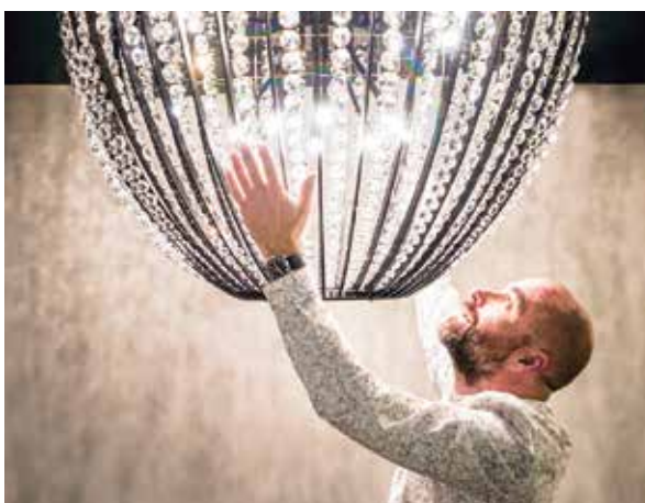
Pri zariaďovaní: archív MS

Nechajte si poradiť. Skúste na začiatku komunikovať s viacerými kreatívcami a vyberte si toho, ktorý vám najlepšie sedí. Lebo realizácia interiéru je vzťah. Musí od začiatku fungovať intenzívne, lebo s tým človekom prežijete rok, dva.