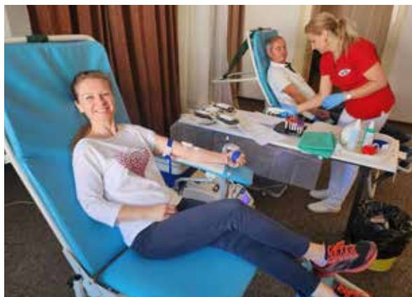
Letná Primátorská kvapka krvi.

Pokiaľ ste sa rozhodli prísť darovať krv, majte na pamäti, že sa treba vopred prihlásiť. „Prosíme záujemcov, aby sa na odber krvi prihlásili na