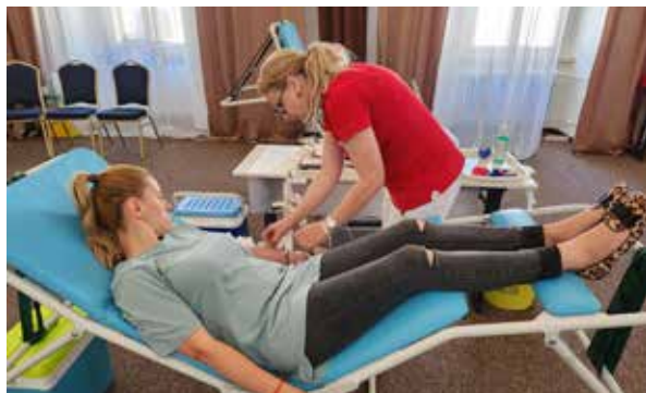
Letná Primátorská kvapka krvi.

mobilnom t. č. 0905964475. Pridajte sa aj vy k ľuďom, ktorí svojou krvou zachraňujú ľudské životy,” vyzýva radnica.