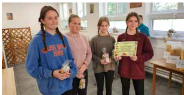
Žiačky Základnej školy Mojmirova.

Piatok 6. októbra 2023 zaplnili Strednú odbornú školu obchodu a služieb v Zlatých Moravciach deviatimi základnými škôlami z okresu Zlaté Moravce. Konali sa tu totiž hneď dve zaujímavé súťaže.