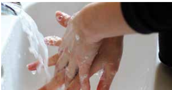
Ilustračná foto, zdroj: pixabay.com, ivabalk

Umývanie rúk patrí medzi základné hygienické návyky, ktoré by každý z nás mal dodržiavať. Deň 15. október je Svetovým dňom umývania rúk a jeho cieľom je poukázať na to, že práve tento jednoduchý úkon je veľmi dôležitý pri prevencii rôznych infekčných chorôb.