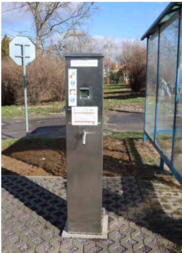
Výdajný stojan na vodu pri mlyne.