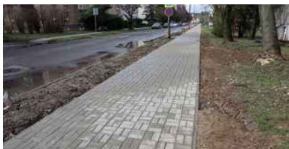
Chodník na Ul. 1. mája.

„Cieľom projektu bolo vybudovanie chodníka na Ulici 1.mája a komunikácie a chodníka na Ulici Robotnícka, pretože tieto komunikácie boli v nevyhovujúcom stave. Chodník na Ul. 1. mája začal rekonštrukciu na styku s mostom ponad