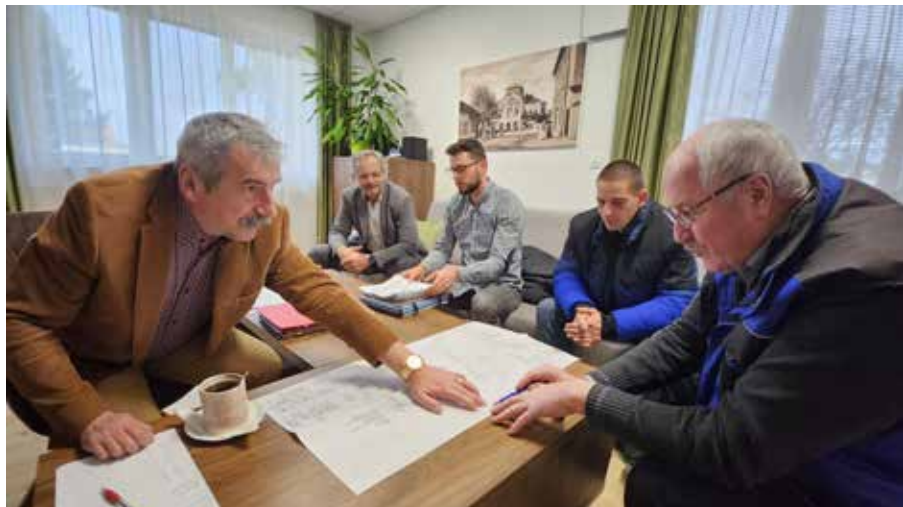
Rokovanie na MsÚ pred začiatkom výmeny plynovodov.