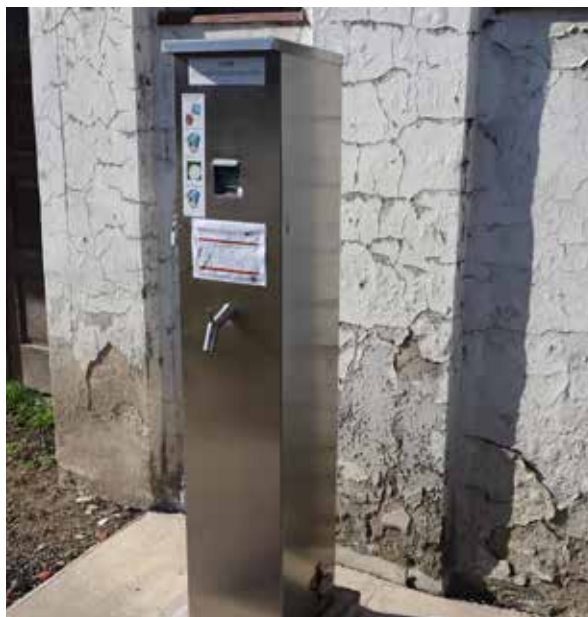
Výdajný stojan na vodu pri požiarnej zbrojnici.

Výdajník vody funguje v nepretržitej prevádzke 24 hodín denne a je monitorovaný