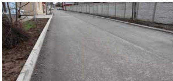
Cesta na Robotníckej ulici.