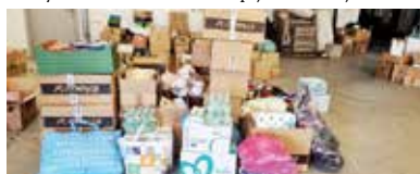
▼ Sklady s pomocou pre Ukrajinu sa postupne plnia.