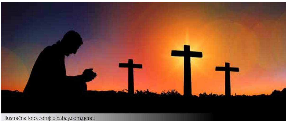
Ilustračná foto, zdroj: pixabay.com,geralt