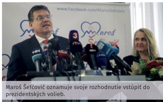
Maroš Šefčovič oznamuje svoje rozhodnutie vstúpiť do prezidentských volieb.