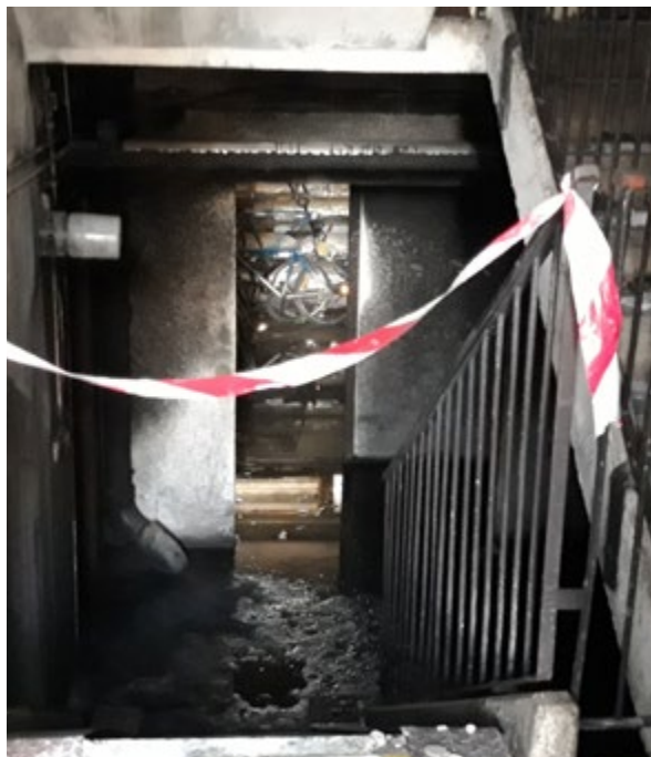
Miesto vzniku požiaru.

Celý prípad je už v rukách polície. Podľa slov krajskej policajnej hovorkyne Boženy Bruchterovej mal neznámy páchatel požiar založiť použitím doposiaľ nezistenou horľavou látkou. „Tým vydal obyvateľov bytového domu do nebezpečenstva smrti alebo ťažkej ujmy na zdraví. Obyvatelia museli byť evakuovaní do doby odvetrania bytového domu, pričom požiarom došlo k po-