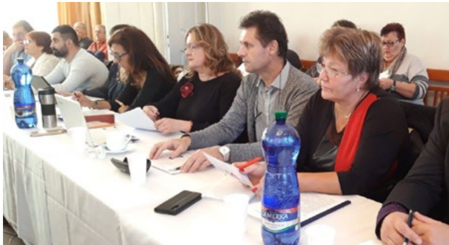
Poslanci Zlatých Moraviec.