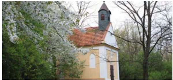
Kaplnka sv. Anny.

Zlatomoravská kalvária sa nachádza na okraji mesta. Postavená bola v druhej polovici 19. storočia pri miestnom prameni a staršom pútnickom mieste - Kaplnke sv. Anny z roku 1850,