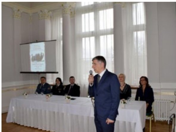
Slávnostné vyhodnotenie výtvarnej súťaže.

V pondelok 11. februára 2019, na európsky deň čísla tiesňového volania 112, sa v priestoroch svadobnej sieňe Zámku Topolčianky uskutočnilo slávnostné vyhodnotenie národného kola výtvarnej súťaže „Ochranárík čísla tiesňového volania 112 a civilnej ochrany“ spojené s vernisážou ocenených výtvarných prác.