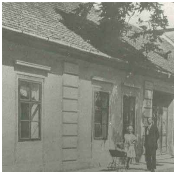
Jedna z budov, v ktorej sa vyučovalo pred postavením budovy školy

tento zámer nakoniec schválila, nakoľko gymnázium malo zlepšiť proces pomaďarčenia mesta a okolia.