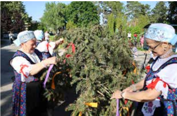
Stavenie mája v Prílepoch.