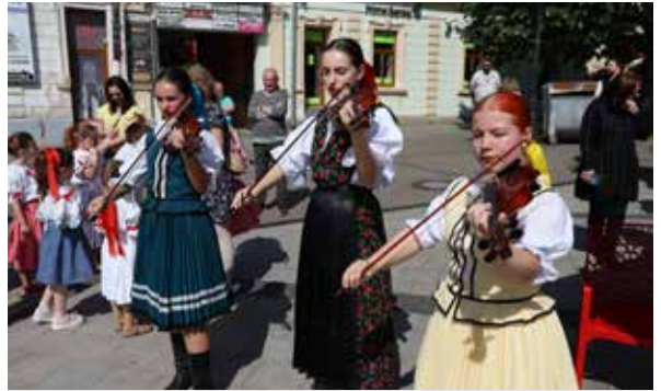
Stavenie mája v Zlatých Moravciach.

Máj sa staval aj v mestskej časti Prílepy, konkrétne pred miestnym kultúrnym domom. Vztýčený bol rovnako v utorok 30. apríla 2024 o 17.00 hodine. Ani tu nechýbala dobrá