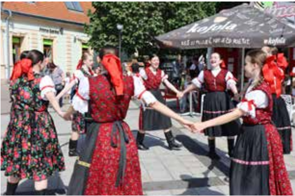
Stavenie mája v Zlatých Moravciach.