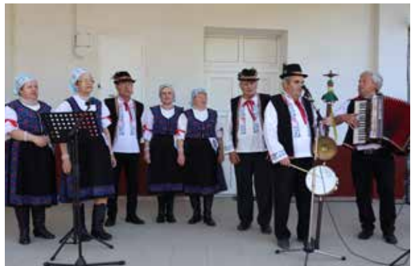
Stavenie mája v Prílepoch.