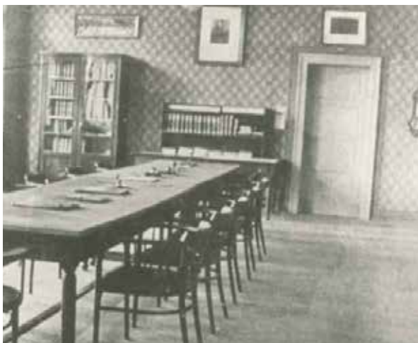
Zborovňa školy 1924

Ľady sa pohli v roku 1911, kedy zlatomoravecké mestské zastupiteľstvo rozhodlo urýchliť zriadenie gymnázia tým, že venovalo na stavbu budovy pozemok a na výstavbu prispelo finančnou čiastkou 300 000 korún. Budapešť