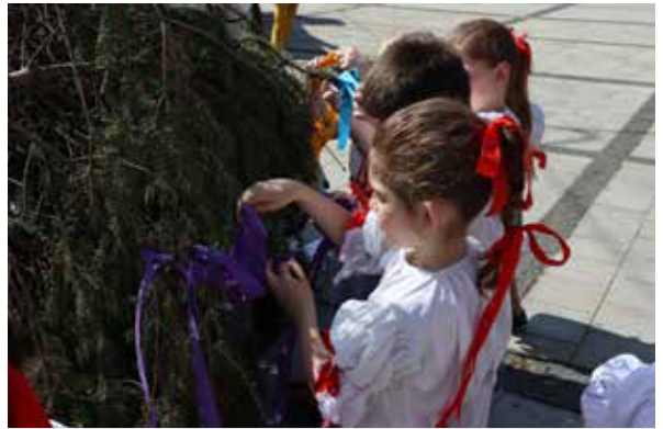
Stavenie mája v Zlatých Moravciach.