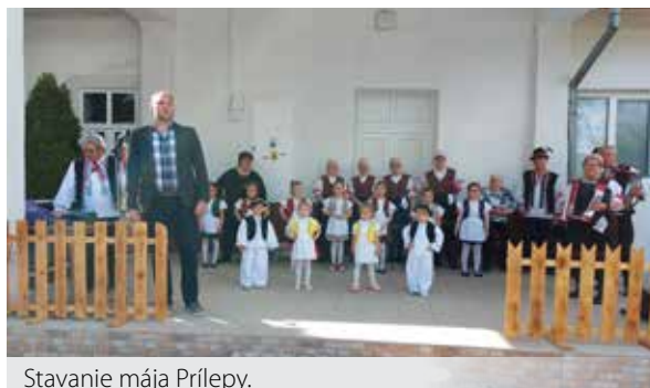
Stavanie mája Prílepy.