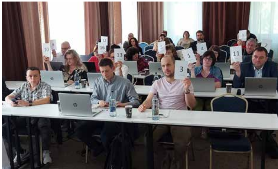
25. zasadnutie Mestského zastupiteľstva v Zlatých Moravciach.