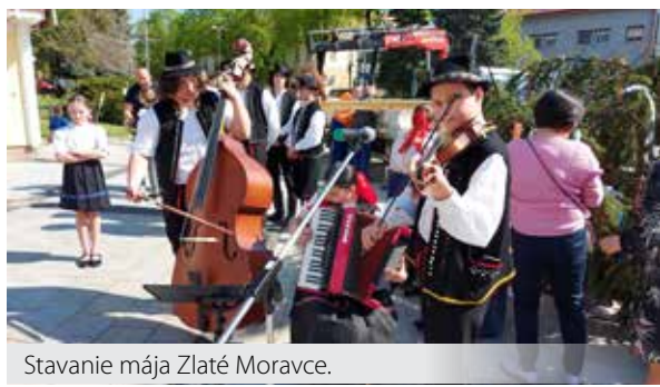
Stavanie mája Zlaté Moravce.