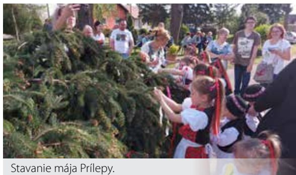
Stavanie mája Prílepy.