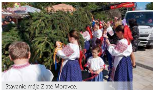
Stavanie mája Zlaté Moravce.