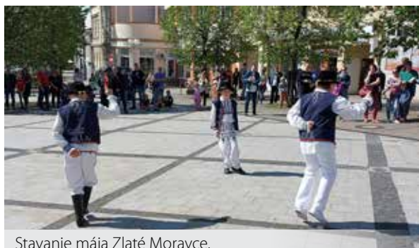
Stavanie mája Zlaté Moravce.