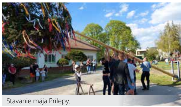
Stavanie mája Prílepy.