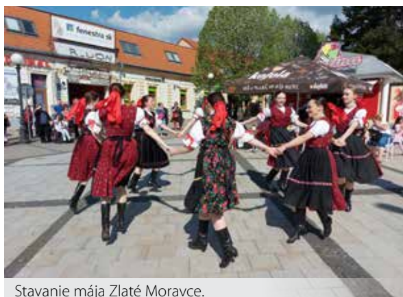
Stavanie mája Zlaté Moravce.

Máje boli známe už v antike. Staroveké národy dávali pred 1. májom na domy