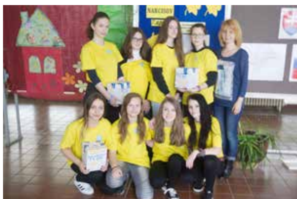
Dobrovoľníčky zo ZŠ Robotnícka.

Som rada, že medzi dobrovoľníkmi, ktorí pomáhajú so zbierkou, sú každoročne aj žiaci našej školy, a sú to tradične žiačky deviateho ročníka a tento rok aj žiačky šiesteho ročníka. Oblečené do krásnych žltých tričiek šiestačky uskutocnili zbierku na škole. Žiaci, učitelia, nepedagogickí pracovníci – všetci prispeli rôznymi čiastkami do pokladničiek. Deväťročnice sa zasa vybrali do ulíc mesta, ale napríklad aj na Mestský úrad. Stretli sa všade s veľmi pozitívnym ohlasom a ľudia prispievali rôznymi sumami na dobrú vec. Výsledná suma, ktorú naše dobrovoľníčky vyzbierali, bola po sčítaní veľmi pekná, bolo to 480,02 eur. Sme radi, že napriek chladnému a upršanému počasiu, sme vyzbierali takúto peknú