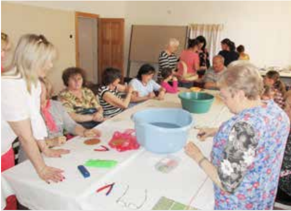
Účastníci workshopu sa pripravujú na pletenie košíkov.

Mestské stredisko kultúry a športu (MSKŠ) si v spolupráci s Úniou zrakovo postihnutých v Zlatých Moravciach pripravilo pre ľudí z mesta a okolia tvorivý workshop pod názvom Pletenie košíkov a vyzdobovanie kraslíc.