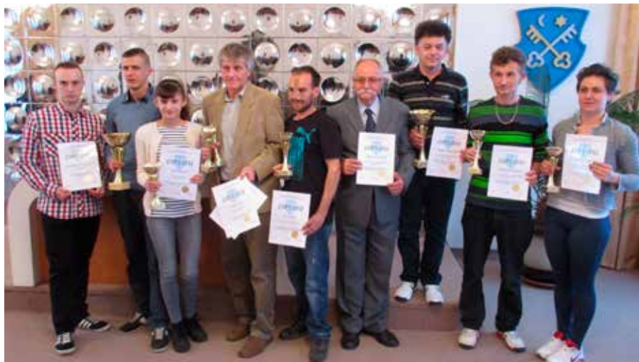
Ocenení športovci za rok 2016.