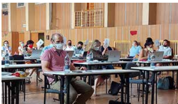
20. rokovanie mestského zastupiteľstva.

materiálno-technických kapacít, na zdravotnícky personál, materiál a pomôcky, lieky a kyslík, dezinfekčné prostriedky, stavebné úpravy