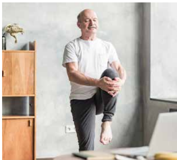
Krásna strečingu spočíva najmä v jeho dostupnosti.