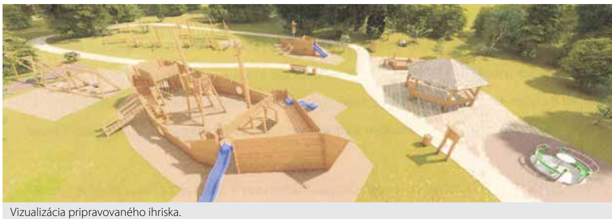
Vizualizácia pripravovaného ihriska.