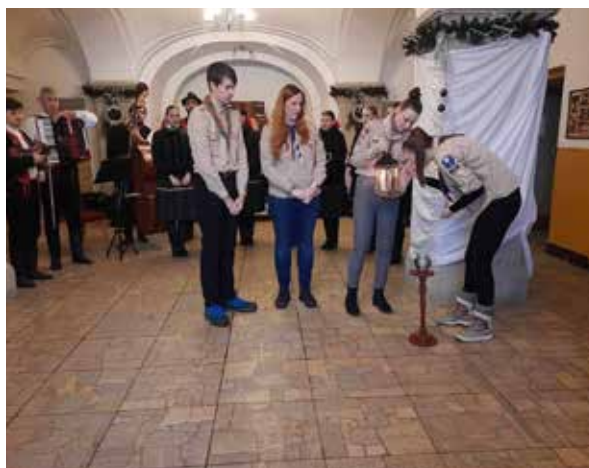
Skauti priniesli Betlehemske svetlo.