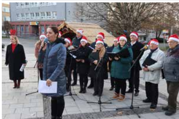
Tretia adventná nedeľa.