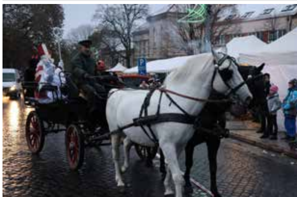
Druhá adventná nedeľa.