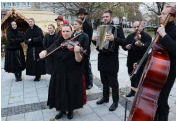
Prvá adventná nedeľa.