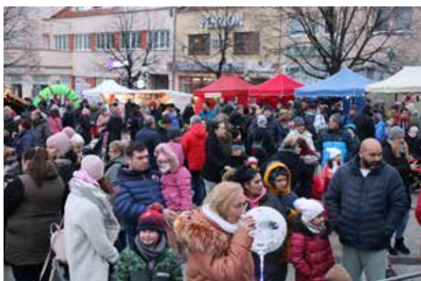
Druhá adventná nedeľa.