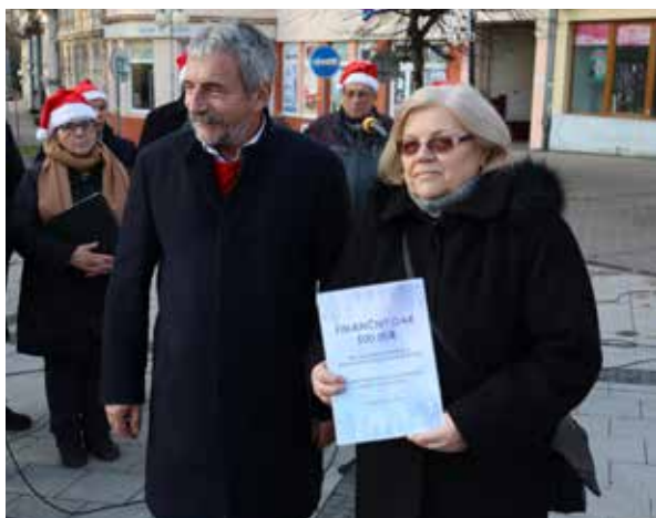
Preberanie šeku pre JDS.