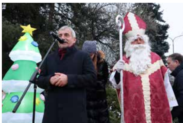
Druhá adventná nedeľa.