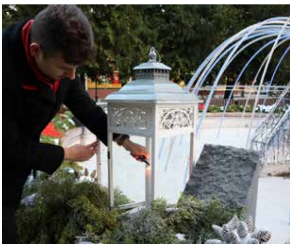
Prvá adventná nedeľa.