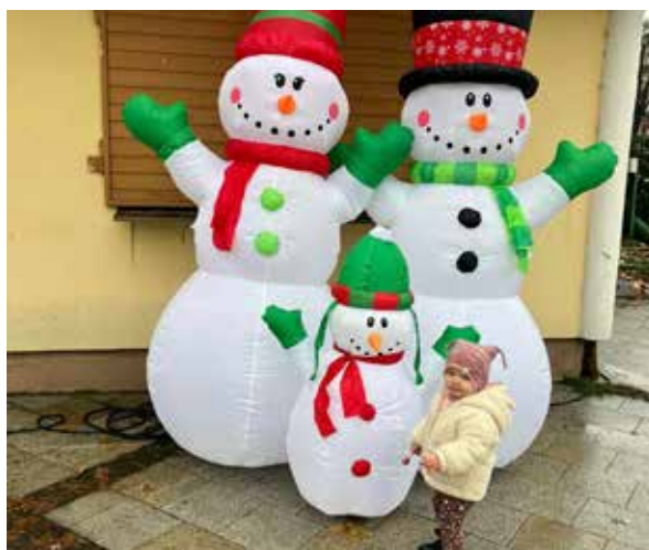
Druhá adventná nedeľa.