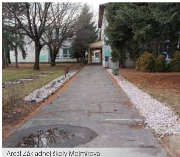
Areál Základnej školy Mojmirova

Mesto Zlaté Moravce chce zrekonštruovať telocvičňu Základnej školy Mojmirova. Urobiť tak chce za pomoci dotačných peňazí z Fondu na podporu športu.