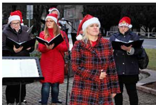
Vystúpenie Carmina Vocum.