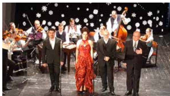
Koncert Čaro Vianoc.