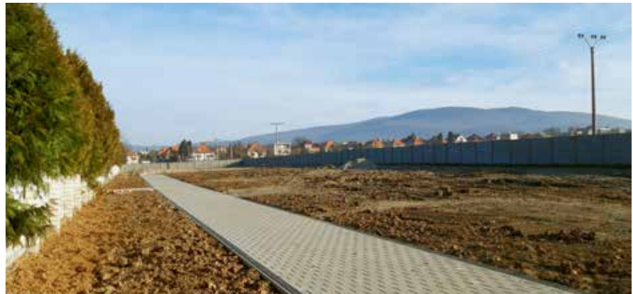
Pohľad na aktuálny stav novej časti cintorína.