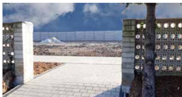
Vstup z pôvodného cintorína do novej časti.

Po kompletnom dobudovaní novej časti by malo na cintoríne pribudnúť až 461 nových hrobových miest. Aktuálne je kapacita mestského cintorína naplnená. Prázdne hrobové miesta sa všetky minuli. K dispozícii sú už len staré hrobové miesta. Táto kritická situácia trvá už od roku 2017. Prázdne hroby v súčasnosti ponúkajú len cintoríny mestskej časti Chyzerovce a Prílepy.