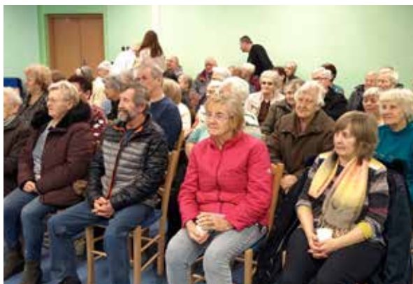
Senióri z DOS.