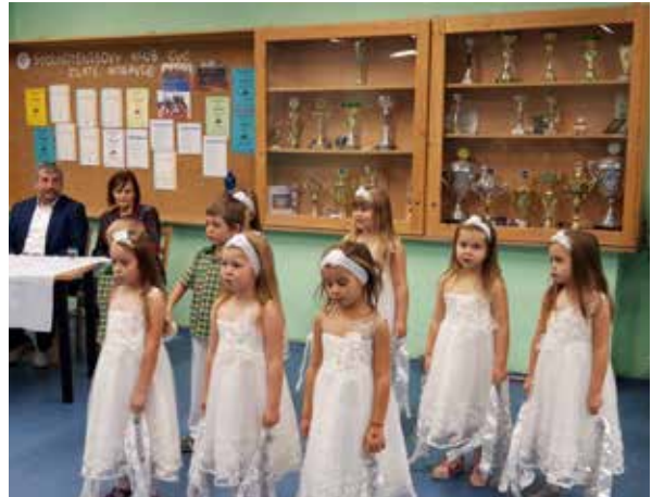
Vystúpenie detí z Materskej školy Kalinčiakova.

So svojím vianočným programom sa následne seniorom predstavili deti z Materskej školy Kalinčiakova a zo Základnej umeleckej školy. Po vystúpení bolo pre všetkých pripravené menšie pohostenie, kde nechýbal ani vianočný punč.