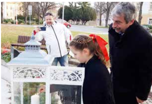
Zapaľovanie prvej sviečky.

V rámci kultúrneho programu vystúpili folkloristi z DFS Zlatňanka a FS Inovec. Ich vianočné koledy si prišlo vypočuť niekoľ-