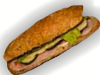
Bavorská bageta 320g