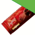
Čokoláda na varenie