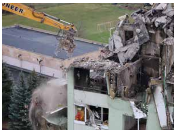
Zničený panelák.

V čase konania 9. zasadnutia zlatomoraveckého Mestského zastupiteľstva sa na účte Prešova nachádzalo viac ako 2 900 000 eur. Finančnú