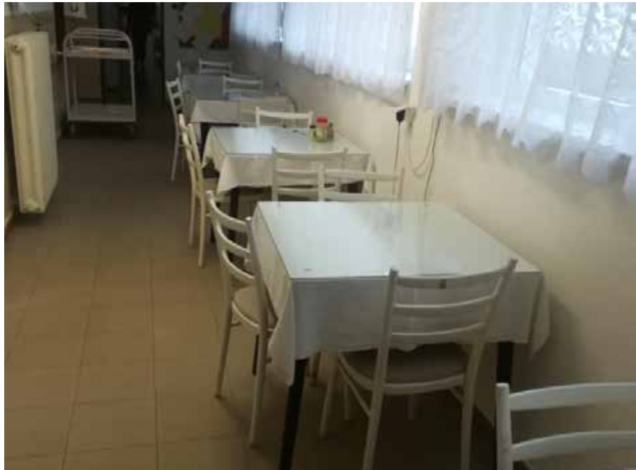
Jedáleň Materskej školy Kalinčiakova.