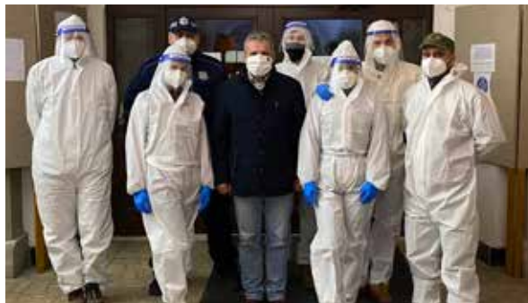
Odberový tím MSKŠ, celoplošné testovanie.

„Tieto odberové miesta sme sa rozhodli zriadiť pre vysoký počet prípadov ochorenia COVID-19, ktoré boli zaznamenané v Zlatých Moravciach v posledných týždňoch. Dúfame, že dopomôžu k zníženiu týchto alarmujúcich čísiel. Všetky tri miesta môžu využiť nielen