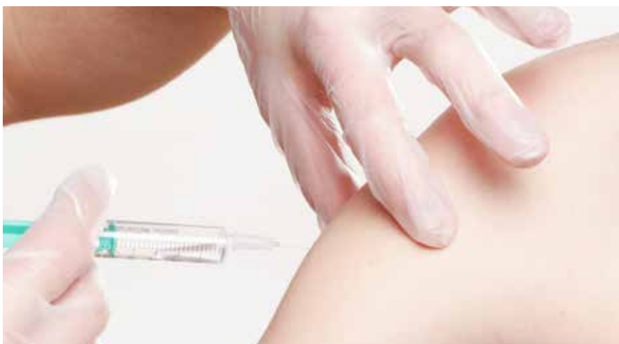
Ilustračná foto, zdroj: pixabay.com, whitesession

Teoreticky áno, ak by sa očkovanie proti Covid-19 zaradilo medzi povinné očkovanie v zmysle vyhlášky MZ SR č. 585/2008 Z.z. Následne by sa na takéto očkovanie vzťahovala aj pokuta v súhrnnej výške 331 eur.