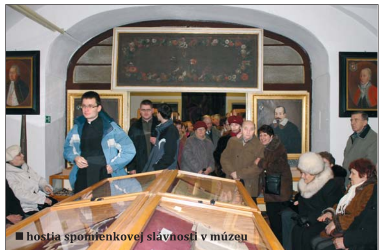
■ hostia spomienkovej slávnosti v múzeu