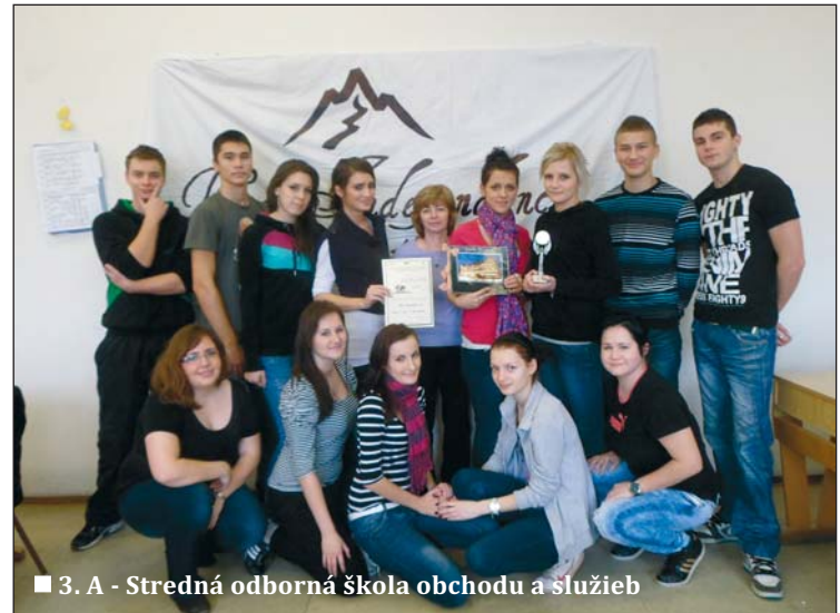
■ 3. A - Stredná odborná škola obchodu a služieb

Konečne sme skoro ráno vycestovali na Medzinárodný veľtrh cvičných firiem, ktorý sa konal v Národnom tenisovom centre v Bratislave. Museli sme tam byť skôr, aby sme stihli ešte pred príchodom návštevníkov postaviť naše dva stánky. Všetko prebiehalo bez väčších komplikácií. Ešte doladiť detaily na kostýmoch, pekne sa usmievať, byť prívetivý