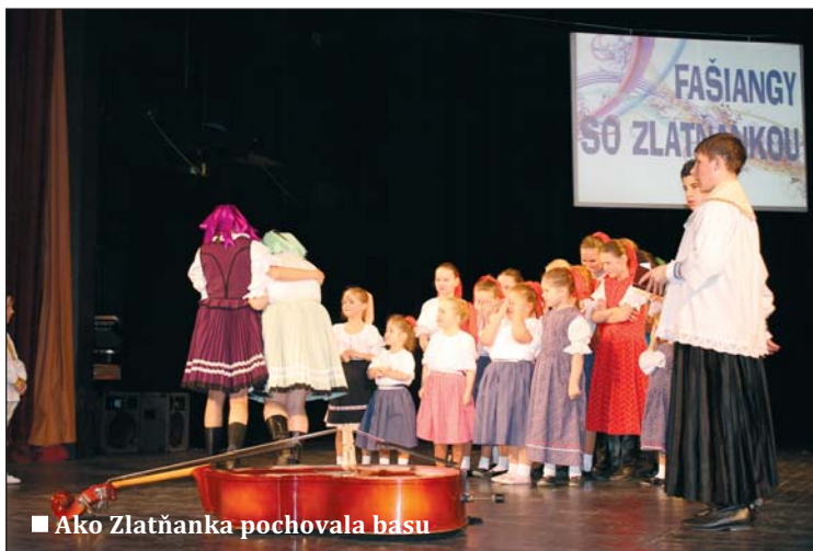
■ Ako Zlatňanka pochovala basu