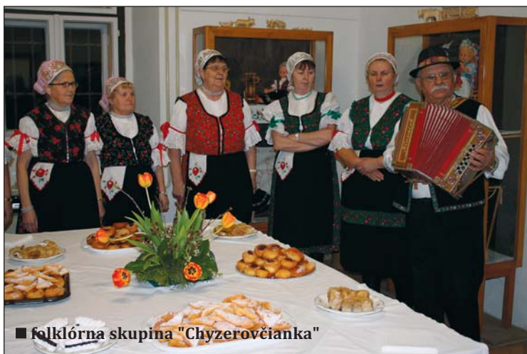
■ folklórna skupina "Chyzerovčanka"