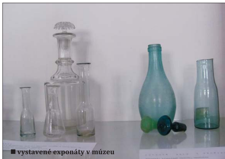
■ vystavené exponáty v múzeu

výrobkov zo skla. Múzeum chce požiadať starostov spomínaných obcí o spoluprácu súvisiacu s oslovením obyvateľov na zapožičanie zachovaných výrobkov do expozície výstavy, ktorá by trvala