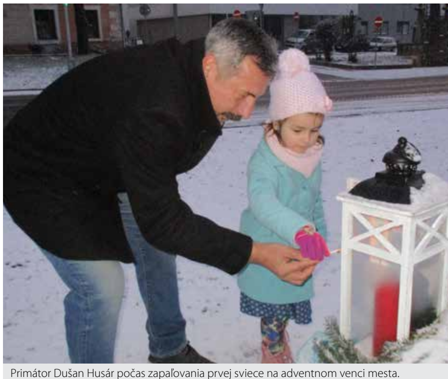
Primátor Dušan Husár počas zapalovania prvej sviece na adventnom venci mesta.