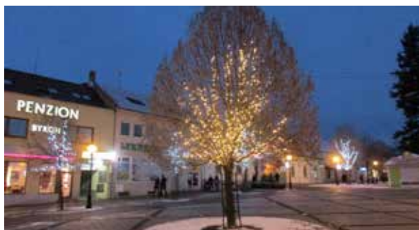
Vianočné osvetlenie Námestia Andreja Hlinku.

Začiatkom decembra sa centrum Zlatých Moraviec rozžiari vianočnými svetlami, ktoré pravidelne počas adventného obdobia a Vianoc zdobia naše mesto. Tento rok na Námestí Andreja Hlinku pribudli i novinky.