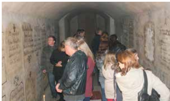
Počas otvorenia krypty.

„Farnosť Zlaté Moravce bola mojim prvým kňazským pôsobiskom. Začínal som tu ako kaplán (od leta 2012), predtým som tu vykonával diakonskú prax (od leta 2011 cez víkendy). Mám k tomuto miestu