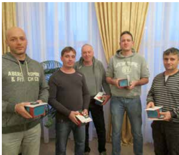
Darcovia ocenení zlatou Janského plakietou.