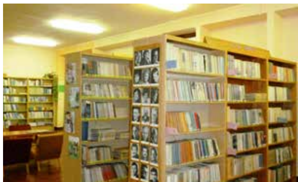
Priestory Mestskej knižnice v Zlatých Moravciach.

Ako ďalej prezradila, všetky knižné novinky sa postupne spracovávajú a čitateľom budú k dispozícii priebežne od decembra 2017. Knižnica