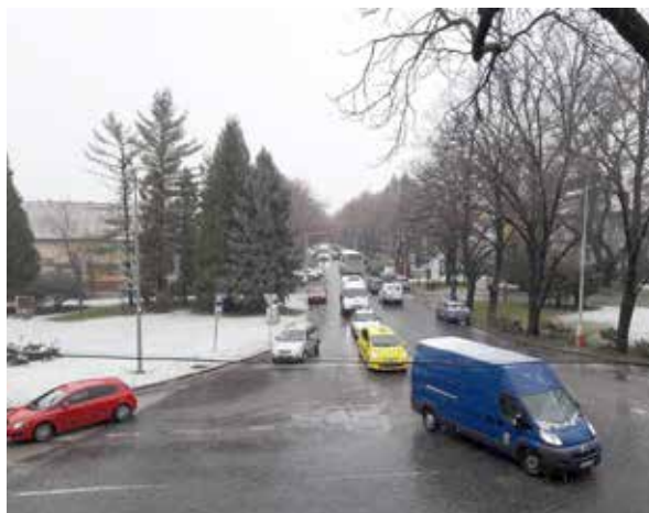
Pohľad na Bernolákovu ulicu.

Plán odhriňania ostáva rovnaký ako po minulé roky.