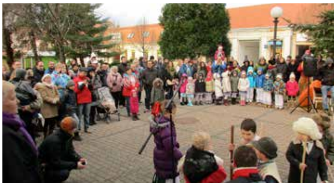
Prvá adventná nedeľa v Zlatých Moravciach.