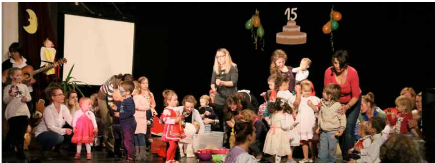
Pätnäste narodeniny Materského centra Mami Oáza.