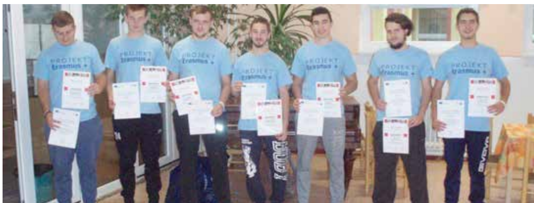
Žiaci Strednej odborne školy polytechnickej.