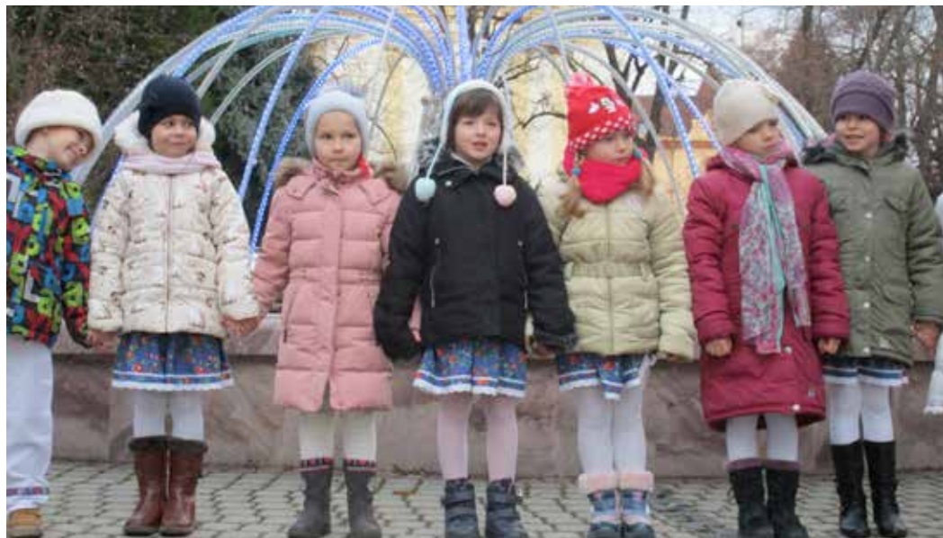
Deti z Materskej školy Žitavské nábřeží.