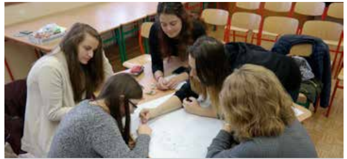
Študenti Gymnázia Janka Kráľa.

Ak aj niekto pochyboval o tom, či je globálne otepľovanie aktuálna téma, v súčasnosti mu to už musí byť úplne jasné. Jedným z najväčších bojovníkov v tomto smere je americký herec Leonardo DiCaprio. Takmer tri roky pracoval na dokumente s príznačným názvom - Pred