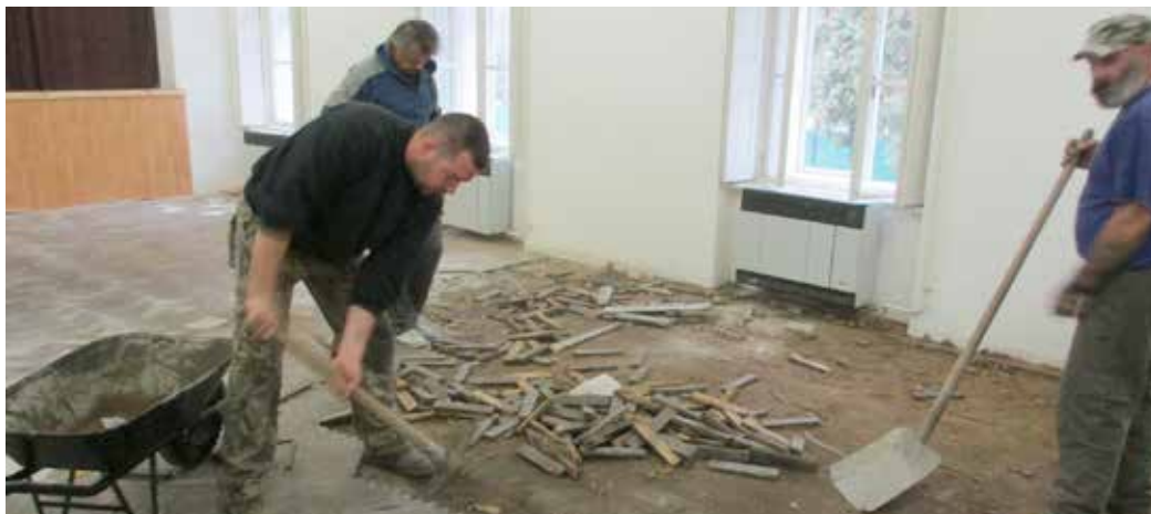
Kultúrny dom v Prílepoch počas rekonštrukcie.