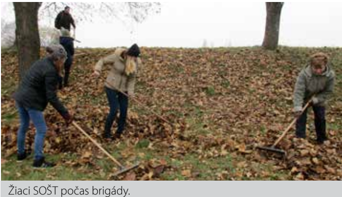
Žiaci SOŠT počas brigády.

Na Mestskom štadióne bolo rušno. Pracovníci Mestského strediska kultúry a športu sa chopili hrabiela pustili sa do upratovania hromady popadaného lístia. Neboli však na to sami. Na pomoc im prišli zlatomoravskí stredoškooláci.