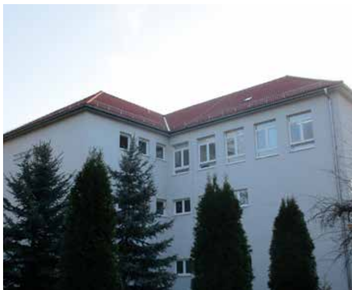
Budova ZŠ Pribinova 1.

Peniaze určené na rekonštrukciu boli podľa Herdovej škole dodané Okresným úradom Nitra, ako účelové nenormatívne finančné prostriedky zo štátneho rozpočtu vo výške 80-tisíc eur. „Cena však za zhotovenie celého diela je vo výške 83 942,82 eur. Rozdiel škola uhradí zo svojich prostriedkov,“ vysvetľuje riaditeľka.