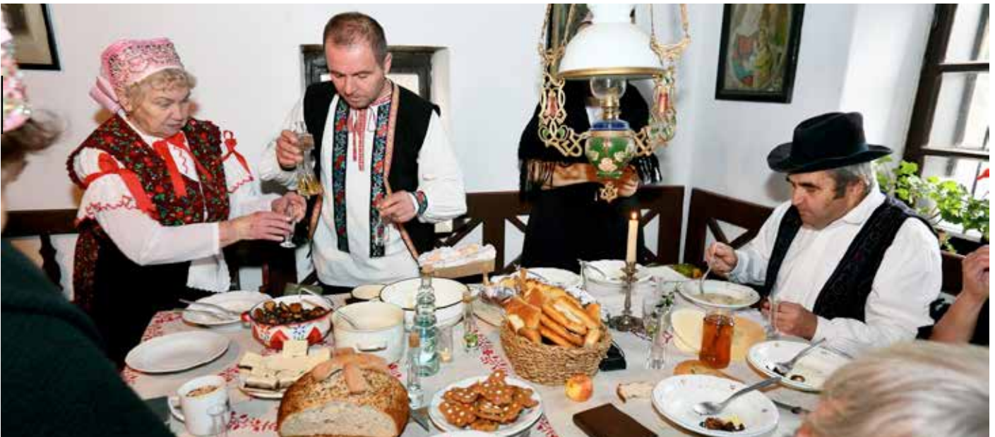
FS Kolovrátok, ukážka tradičného vianočného stolovania.