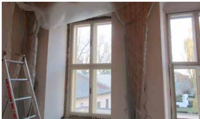
Obradná sála počas rekonštrukcie.

Nové drevené okná sú slonovinovej farby, presne podľa pôvodného náteru ich predchodcov. Zachované sú aj originálne kovania. „Nie sú