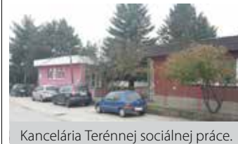
Kancelária Terénnej sociálnej práce.