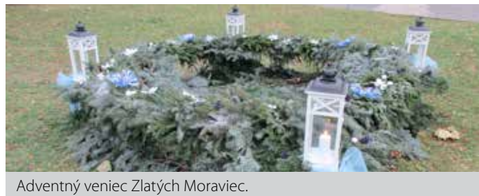
Adventný veniec Zlatých Moraviec.