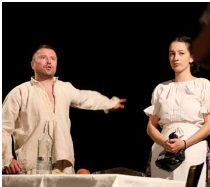
Piaty ročník Tradičného ochotníckeho divadla.