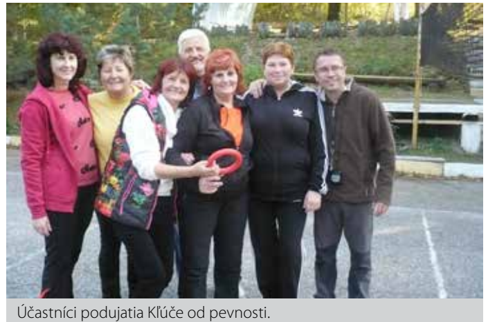
Účastníci podujatia Kľúče od pevnosti.