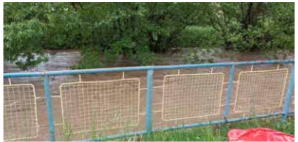
Rieka Žitava počas intenzívnych lejakov.