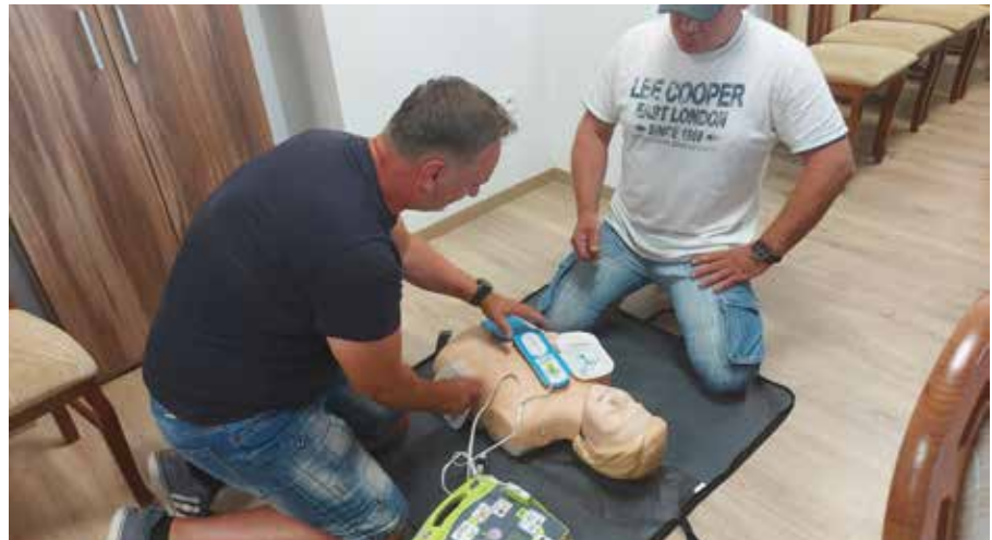
Mestskí policajti skúšajú nový prístroj.