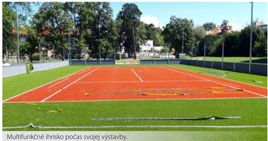
Multifunkčné ihrisko počas svojej výstavby.