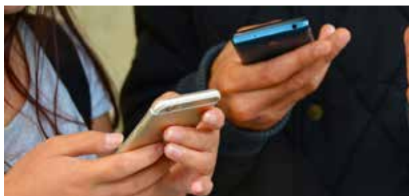
Ilustračná foto, zdroj: pixabay.com, terimakasih0

„Dotáciu sme dostali len na jeho zriadenie. Mesačné faktúry by už uhrádzalo v plnej sume mesto. Keďže projekt vyžadoval garantovanie určitej rýchlosti internetu pre každú pripojenú osobu, bolo