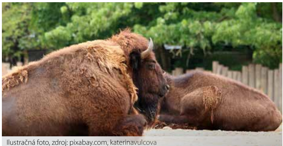
Ilustračná foto, zdroj: pixabay.com, katerinavulcova

Pokiaľ ide o spôsoby dopravy (zoradené od najviac po najmenej ekologické), skúste pešiu turistiku, cykloturistikú,