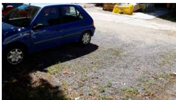
Súčasný stav parkoviska MsÚ.

„V rámci projektu budú riešené vodozádržné opatrenia v priestoroch parkoviska Mestského úradu v Zlatých Moravciach, a to výmenou nepriepustných plôch za polopriepustné