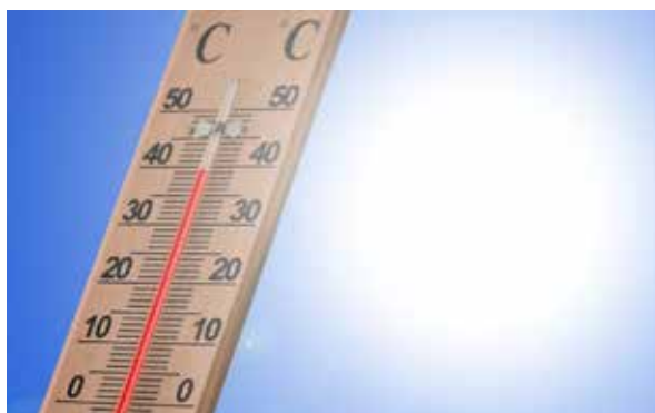
Ilustračná foto, zdroj: pixabay.com, geralt

„Vysoká hodnota teploty vzduchu uvádzaná v kronike mohla byť nameraná teplomerom, ktorý mohol byť