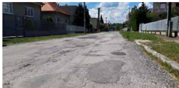
Ulica Slovenskej armády

Tieto rekonštrukcie budú finančne hradené z rozpočtu mesta. Na Družstevnú ulicu je vyčlenených 197 893 eur. Ulica Slovenskej armády bude lacnejšia. Vyžiada si 96 825 eur, nakoľko tu sa nebude