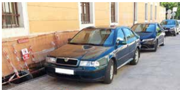
Ulica Andreja Kmeťa

„V minulosti naši zamestnanci parkovali vo vnútri areálu kaštieľa. Nakoľko park prešiel v posledných týždňoch rozsiahlou revitalizáciou, parkovanie áut tu už nie je možné.