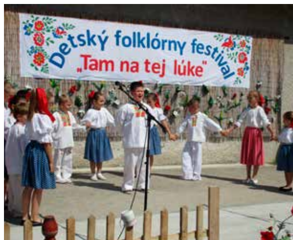
Festival sa konal na pódiu v areáli KD Chyzerovce.

Festivalu sa zúčastnili štyri folklórne súbory. Zahrali a zapievali deti zo zlatomoravského detského folklórneho súboru (DFS) Zlatňanka, DFS Rochánik zo Slažian, DFS Kamienok z Machuliniec a DFS Drienka z Trnavy. Pôvodne