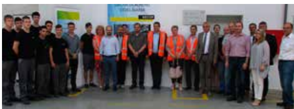
Počas otvorenia duálnej dielne.

Zaujímavou novinkou tejto spolupráce je, že SOŠ technická v Zlatých Moravciach zavádza ako jediná škola na Slovensku od septembra 2017 nový študijný odbor - mechanik chladiarenskej a klimatizačnej techniky. „Naša spoločnosť bude mať prvých študentov, ktorí budú uplatňovať tento odbor prostredníctvom duálneho vzdelávania,“ povedala na záver hovorkyňa spoločnosti Secop.