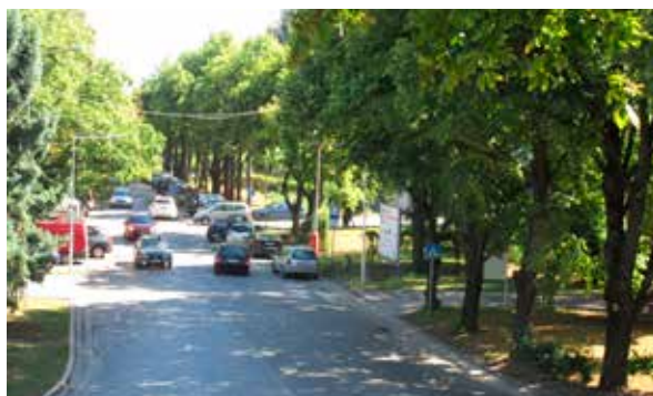
Bernolákova ulica v Zlatých Moravciach.