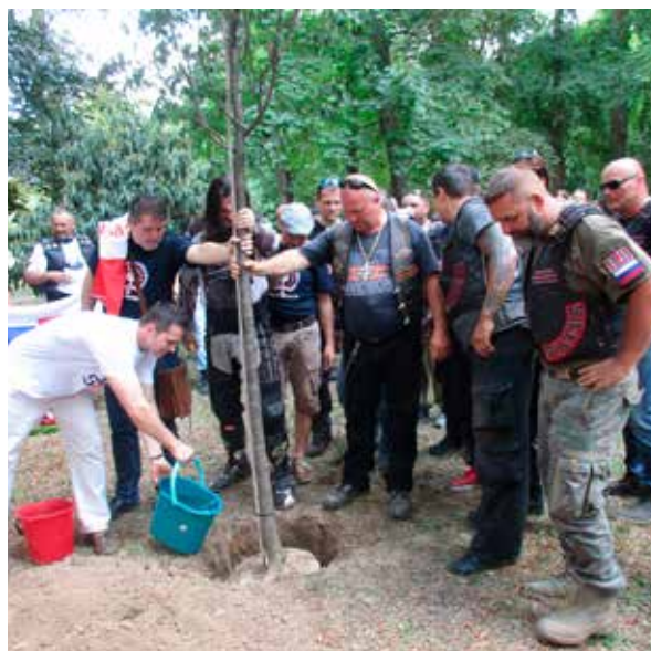
Lipa bola zasadená oproti amfiteátru.

Nechýbala tu ani dávka folklóru. Najskôr vystúpili deti z nášho domáceho