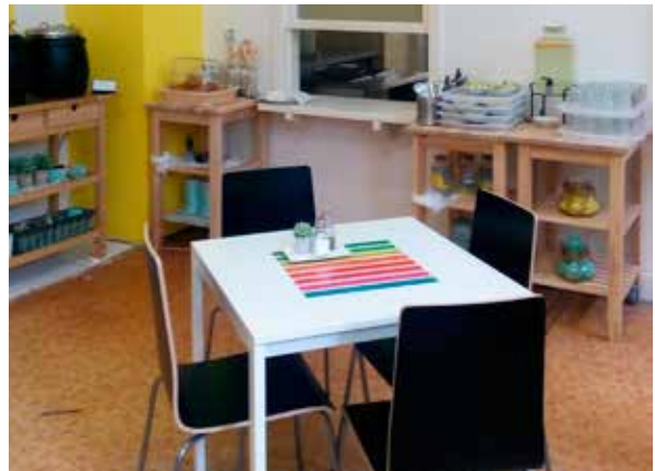
Jedáleň po rekonštrukcii.

Zmenou v zlatomoravskej nemocnici neprešla len jedáleň, ale aj kvalita pokrmov. V súčasnosti sa každodenne varia viaceré typy obedov. Nemocnica postupne