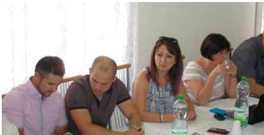
Rokovanie poslancov v mestskej časti Prílepy.