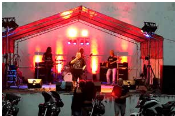
Vystúpenie kapely AC/DC Revival.

Začiatok júla potešil milovníkov rockovej hudby zo Zlatých Moraviec a širokého okolia. V našom meste sa uskutočnil Rockový koncert, na ktorom sme si mohli vychutnať vystúpenie hneď troch kvalitných kapiel.