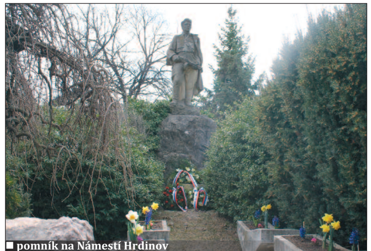
■ pomník na Námestí Hrdinov

26. 5. – oslava sviatku sv. Urbana (patróna vinohradníkov) o 16.00 h v Chyzeroveckých viniciach