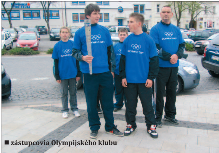
■ zástupcovia Olympijského klubu

Pomaly, ale isto sa blíži začiatok jubilejných XXX. letných olympijských hier, ktoré sa budú konať od 27. júla 2012 v Londýne. Pri tejto príležitosti naše mesto Zlaté Moravce prevzalo posolstvo.