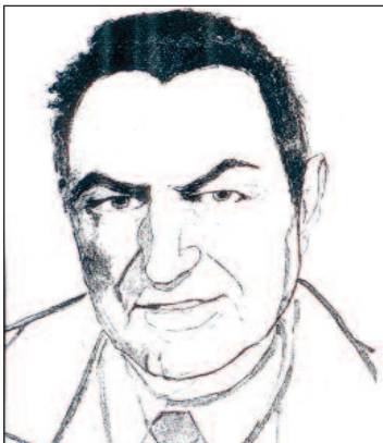
kresba - František Valenta