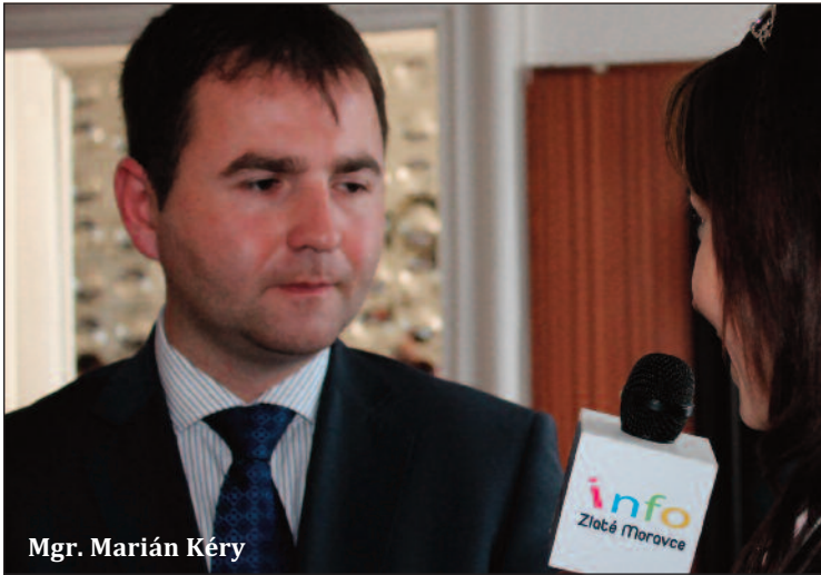
Mgr. Marián Kéry

Na poslednom zasadnutí Mestského zastupiteľstva vystúpil so svojim príhovorom aj poslanec Národnej rady Slovenskej republiky Mgr. Marián Kéry, aby predovšetkým poďakoval za podporu svojim voličom v posledných parlamentných voľbách nielen zo svojej pozície, ale aj za celú stranu SMER – SD.