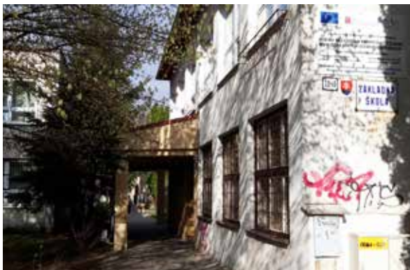
Základná škola Mojmirova.

Biochemické laboratórium získalo interaktívnu tabuľu, dataprojektor, vizualizér, notebook s aplikačným softvérom, zakúpené boli aj špeciálne laboratórne stoly, biologické mikroskopy, sady nástenných biologických tabulí, sady anatomických, botanických a zoológických modelov, rešuscitačná figurína a sady mikropreparátov.