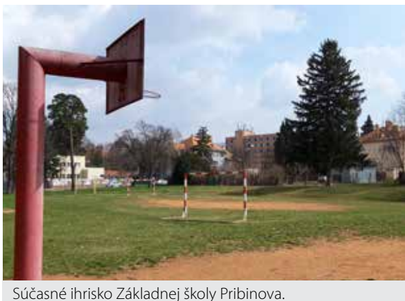
Súčasnú ihrisko Základnej školy Pribinova.

Športovisko pre deti aj verejnosť v súčasnosti už postupne vyrastá v areáli Základnej školy (ZŠ) Mojmirova. Mesto chce podobný projekt zrealizovať aj na svojej ďalšej základnej škole – na Pribinke. Zastupiteľstvo odsúhlasilo podanie žiadosti o poskytnutie dotácie.