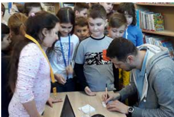
Autogramiáda Stanislava Repaského.