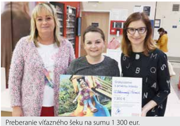
Preberanie víťazného šeku na sumu 1 300 eur.

Spoločnosť Tesco Stores zorganizovala už piaty ročník programu „Vy rozhodujete, my pomáhame“. Ľudia mohli v hlasovaní rozhodovať, ktorý z troch projektov z nášho regiónu získa najvyššiu finančnú pomoc.