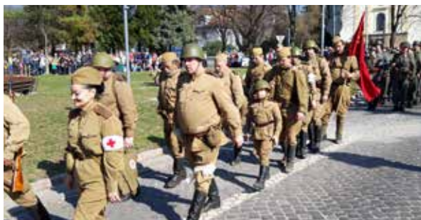
Pochod vojakov po ukončení bojov.

Námestím Andreja Hlinku a jeho okolím sa ozývala intenzívna strelba zo samopalov a pušiek. Zlaté Morave prišli zo zovretia Nacistov vyslobodiť vojaci Červenej armády, presne ako pred 74 rokmi. Samozrejme, nešlo o naozajstnú bitku, ale o rekonštrukciu historických bojov, ktorou sme si pripomenuli výročie oslobodenia.